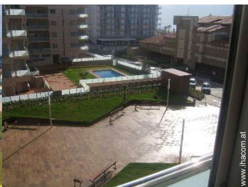
Blick auf Fußgängerzone