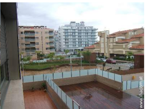
Blick auf Fußgängerzone