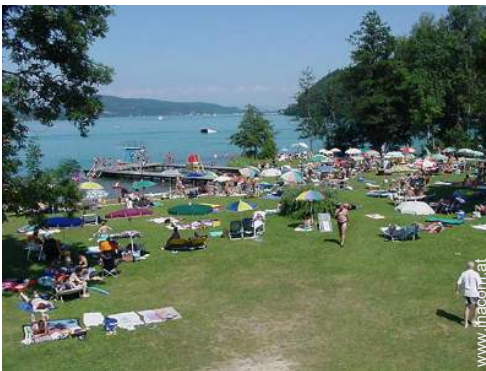
Badevergnügen in der Nähe