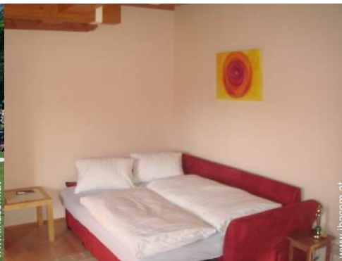
Sofabett(en) 2 Personen