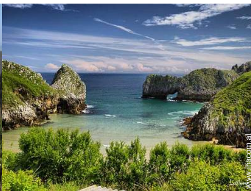
Sommeraktivitäten in der Nähe