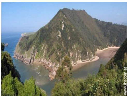
Sommeraktivitäten in der Nähe