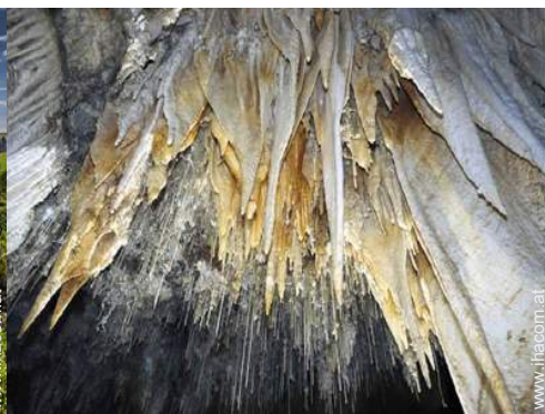
Flugsport in der Nähe