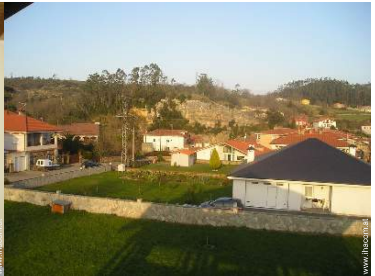
Blick auf Straße/Avenue