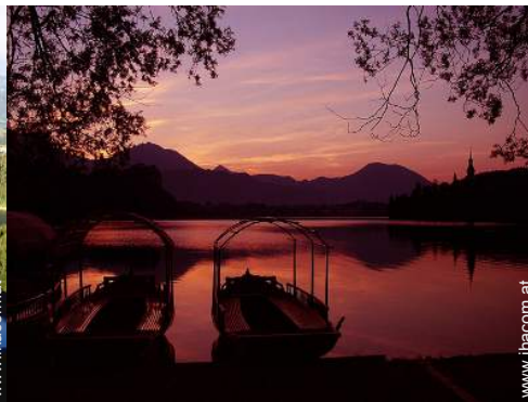
Blick auf See