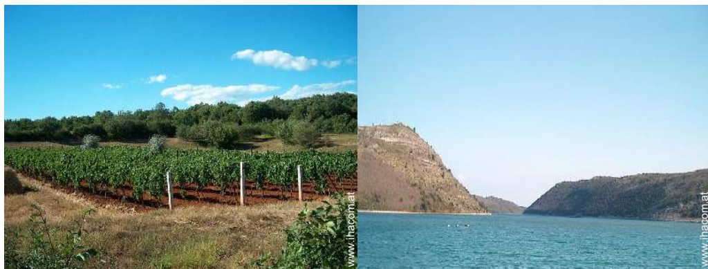
Blick auf Weinberge