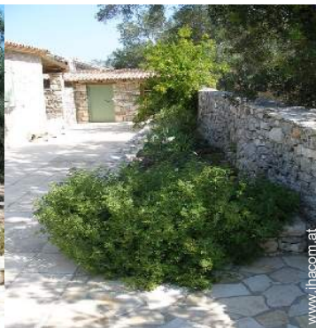
Blick auf Hof