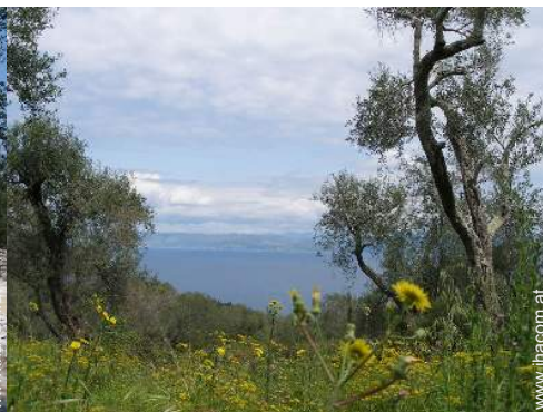
Blick aufs Land