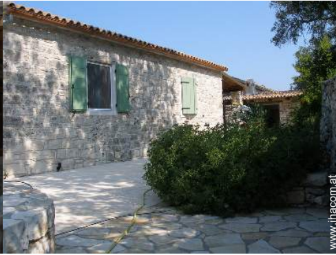
Blick auf Hof