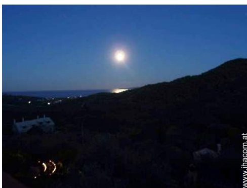
Blick auf Ozean