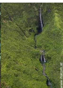
Flugsport in der Nähe