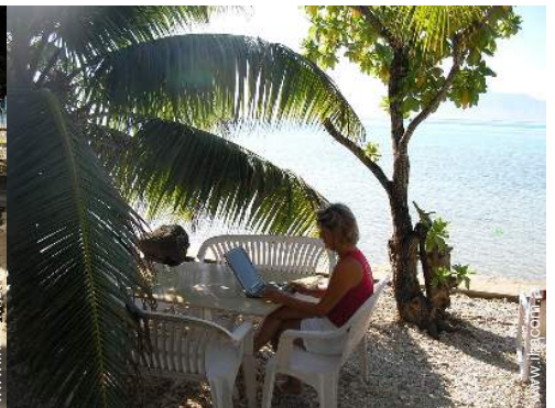
Wi-Fi (drahtloser Internetzugang)