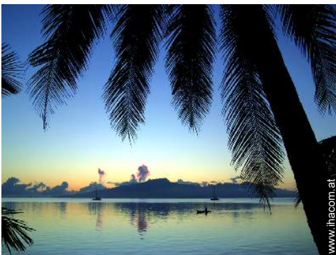
Blick auf Ozean