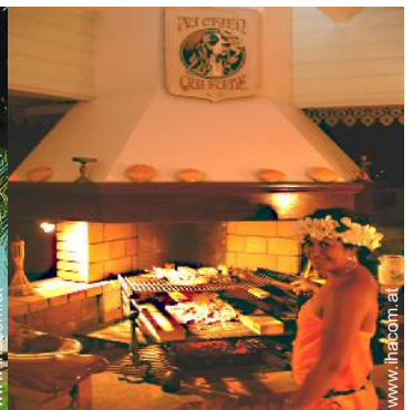
Table d'Hôte (Gemeinschaftstafel)