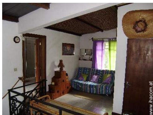
Sofabett(en) 1 Person