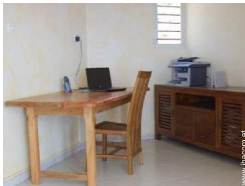
Wi-Fi (drahtloser Internetzugang)