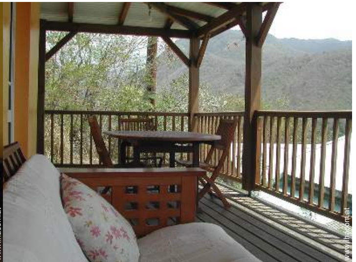
Blick auf Gebirge