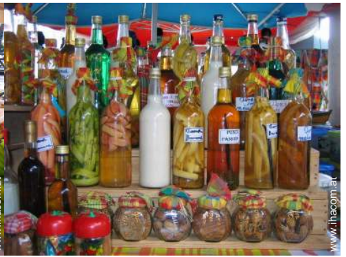
In der Nähe