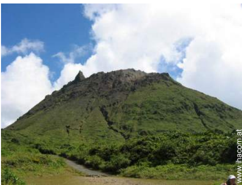
In der Nähe