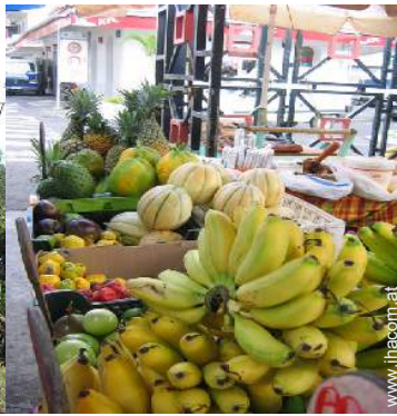
Freizeitaktivitäten in der Nähe