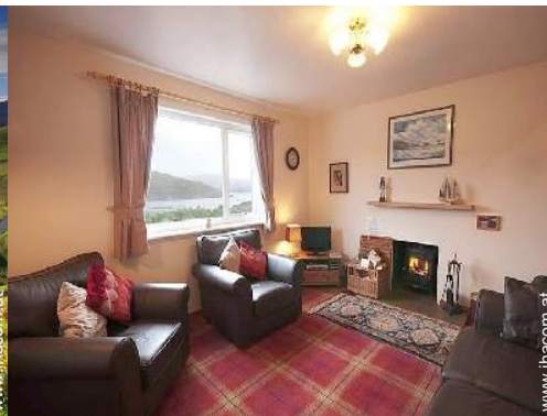
Innenkomfort zur Verfügung der Gäste