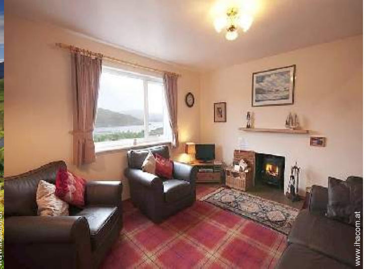
Innenkomfort zur Verfügung der Gäste