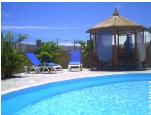
Wi-Fi (drahtloser Internetzugang)