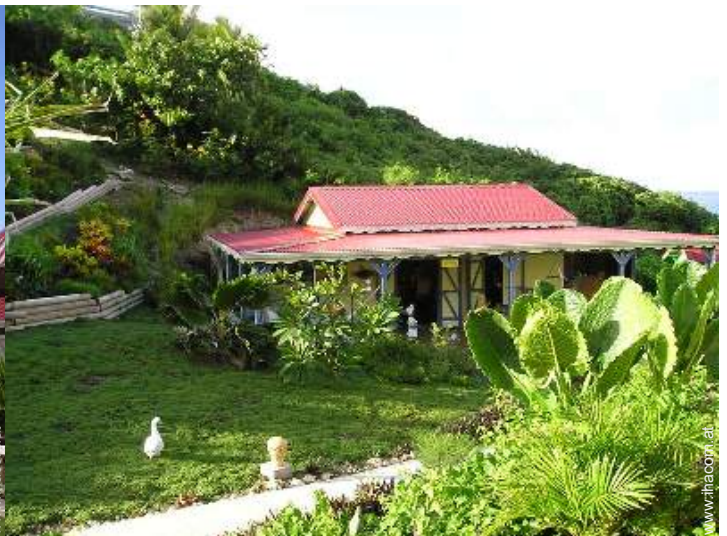
Holzhaus mit Charme