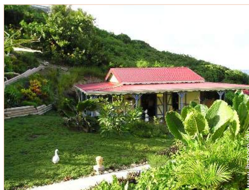
Holzhaus mit Charme