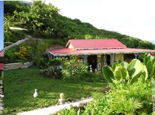
Holzhaus mit Charme