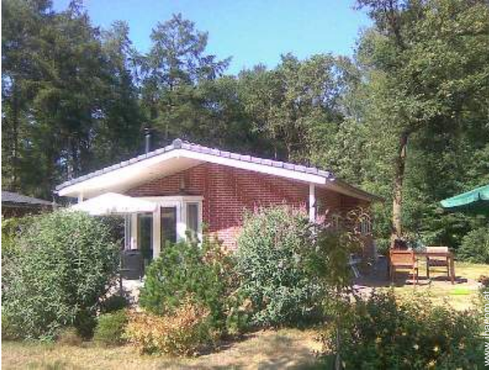
kleine Hütte mit Charme