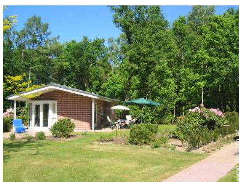
kleine Hütte mit Charme