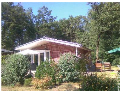
kleine Hütte mit Charme