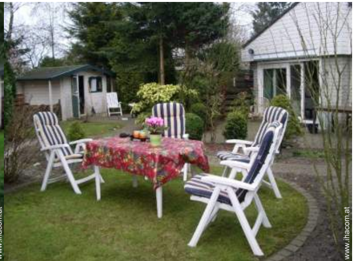
Außenanlage zur Verfügung der Gäste