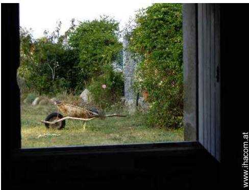
Blick aufs Land