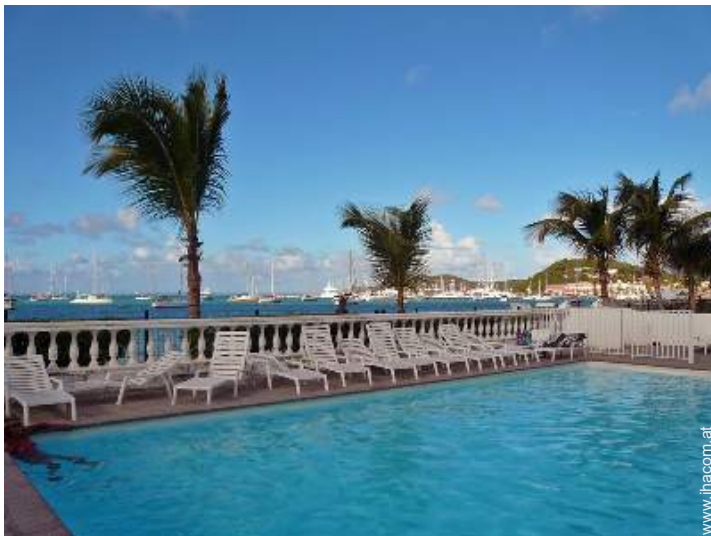
Swimmingpool in Wohnanlage