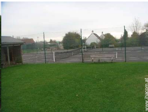
Tennisplatz - harter Belag