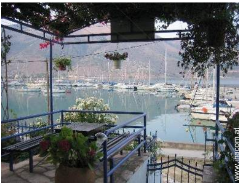
Blick auf Hafen