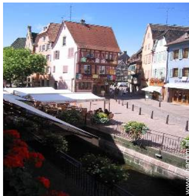
Blick auf Fußgängerzone