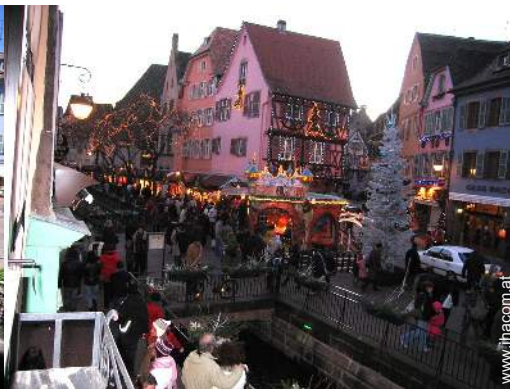
Blick auf Platz