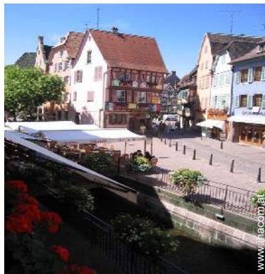
Blick auf Fußgängerzone