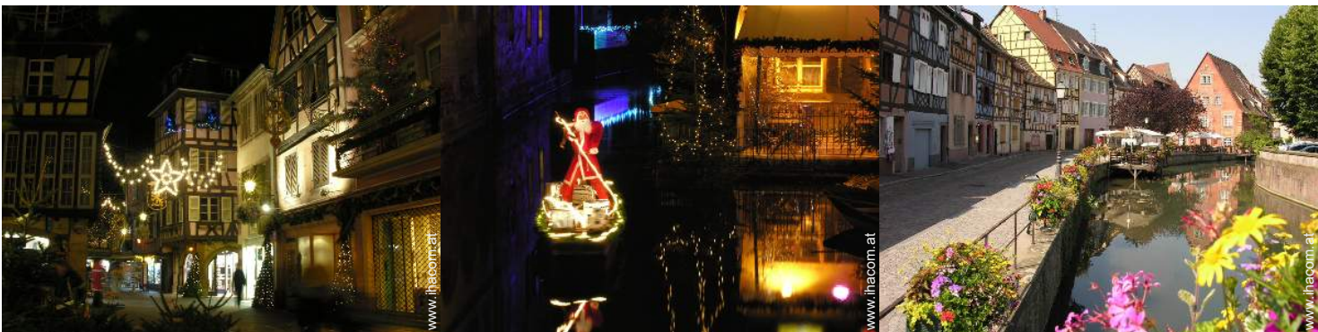
Blick auf Platz