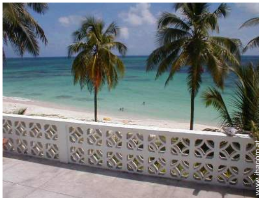
Blick auf Ozean