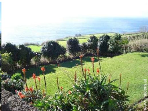
Blick auf Felder