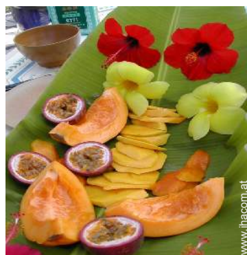
Vor Ort anwesend