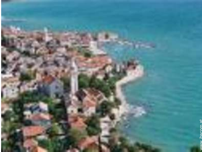
Nahe gelegene Städte