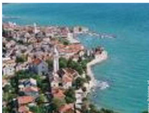
Nahe gelegene Städte