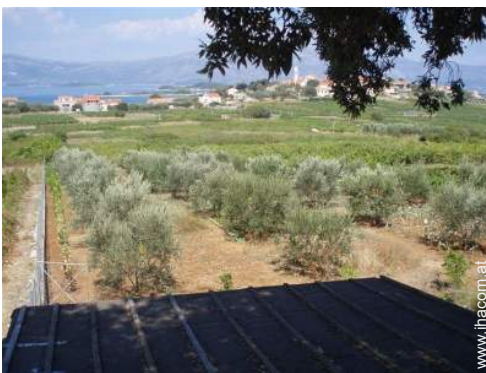
Blick auf Weinberge