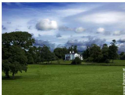
Blick auf Wiese