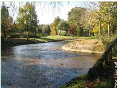
Blick auf Fluss

Besondere Vorzüge : Private Landebahn/privater Flugplatz