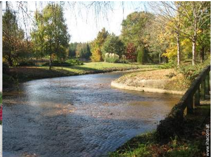
Blick auf Fluss