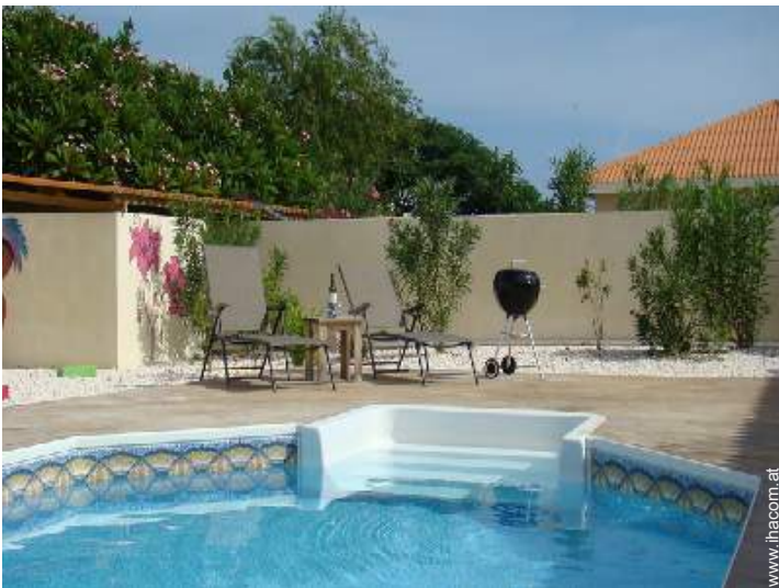
Ausblick überdachte Terrasse