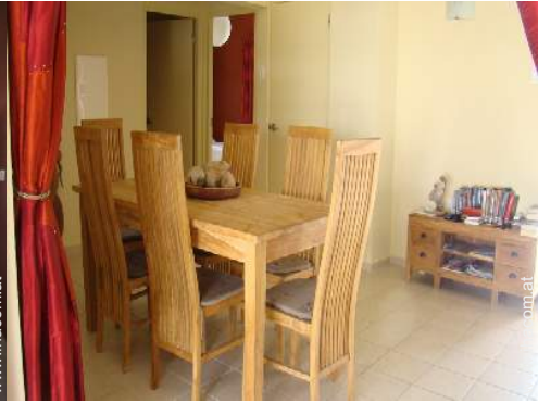
Raumaufteilung und Annehmlichkeiten