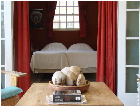
Ausblick überdachte Terrasse