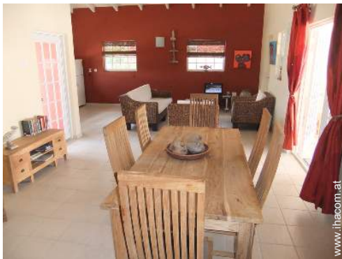
Raumaufteilung und Annehmlichkeiten