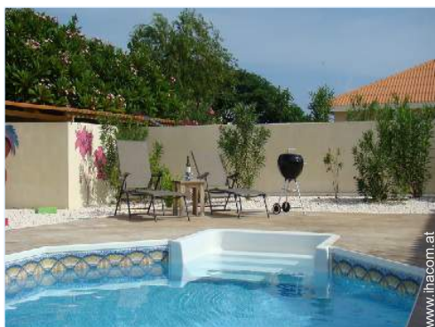
Ausblick überdachte Terrasse