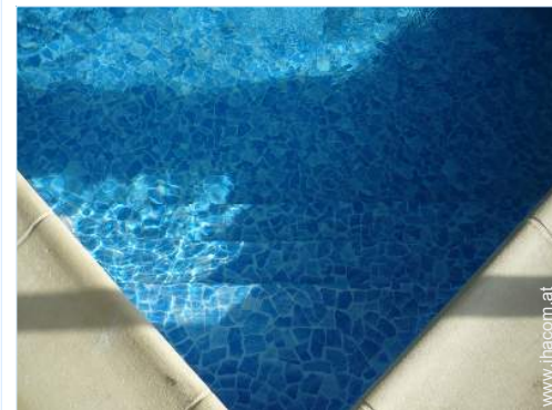
Swimmingpool im Haus