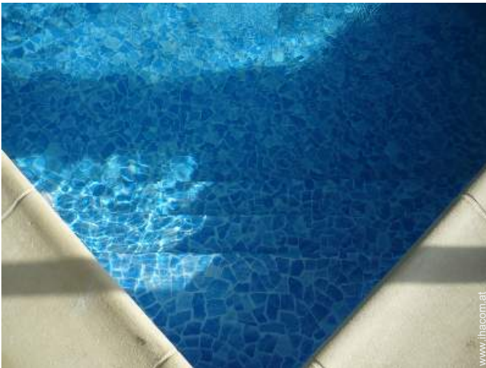
Swimmingpool im Haus