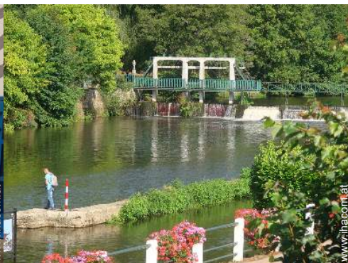
Blick auf Fluss