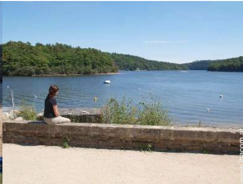
Blick auf See