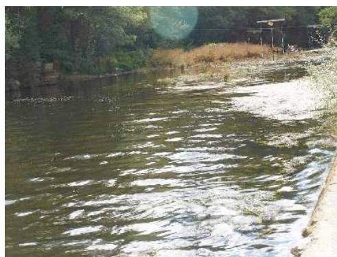
Blick auf Fluss