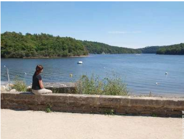
Blick auf See