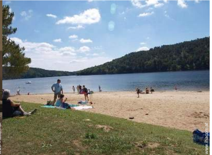
Blick auf See