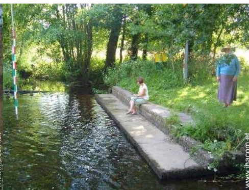
Blick auf Fluss