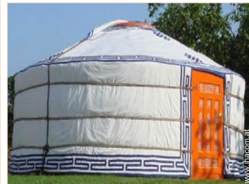
Jurte mit Charme (mongolisches Zelt)