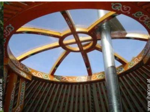
Jurte mit Charme (mongolisches Zelt)