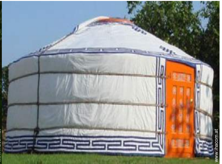
Jurte mit Charme (mongolisches Zelt)