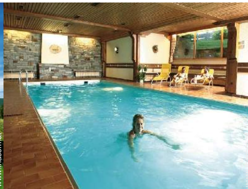
Swimmingpool im Haus