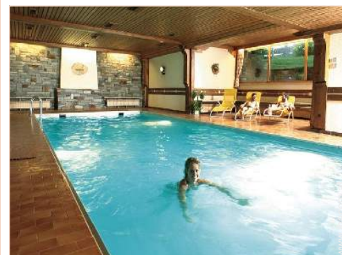
Swimmingpool im Haus