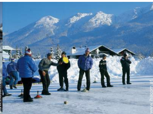
Winteraktivitäten in der Nähe