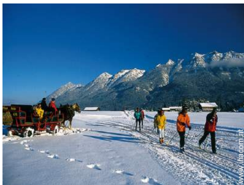
Winteraktivitäten in der Nähe