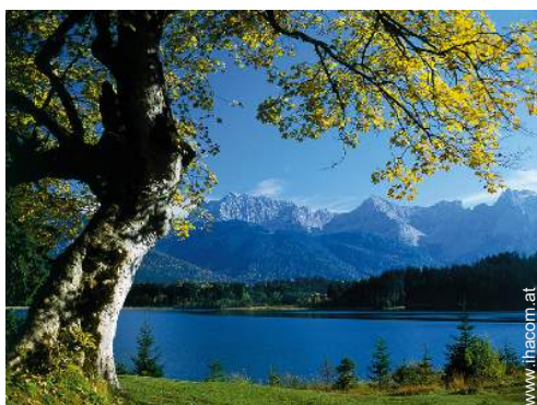
Badevergnügen in der Nähe