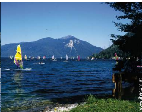
Wassersport in der Nähe