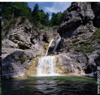
Gebirgsaktivitäten in der Nähe