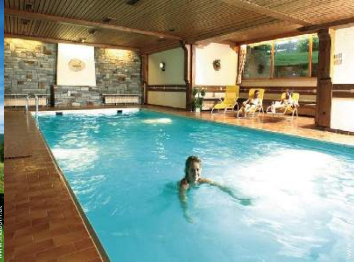
Swimmingpool im Haus