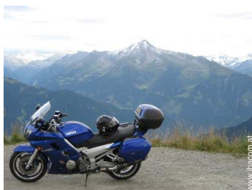
Motorsport in der Nähe