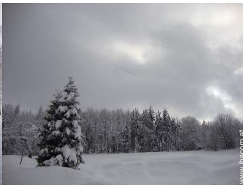
Blick auf Wald