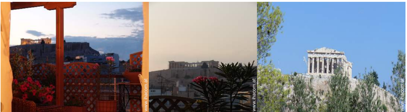
Blick auf Denkmal