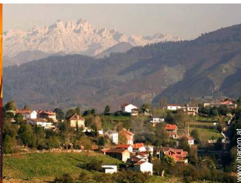
Blick auf Dorfzentrum