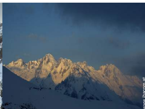
Winteraktivitäten in der Nähe