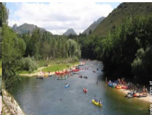
Sommeraktivitäten in der Nähe