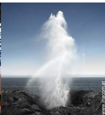
Attraktionen und Entspannung