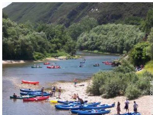
Gebirgsaktivitäten in der Nähe