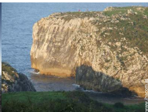
Wassersport in der Nähe