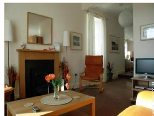
Cottage mit Charme