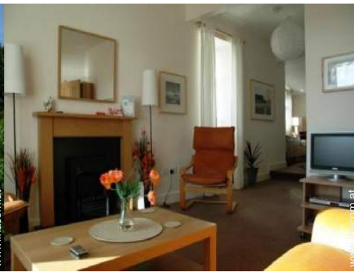
Cottage mit Charme