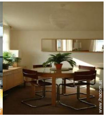
Cottage mit Charme