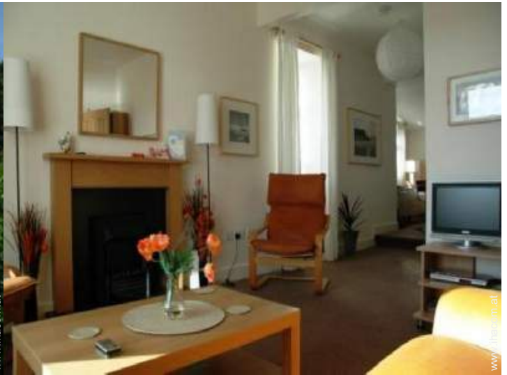
Cottage mit Charme