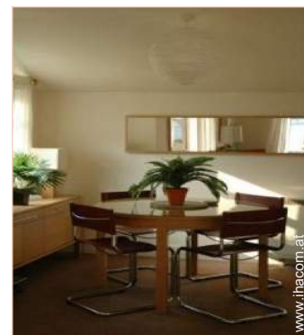
Cottage mit Charme