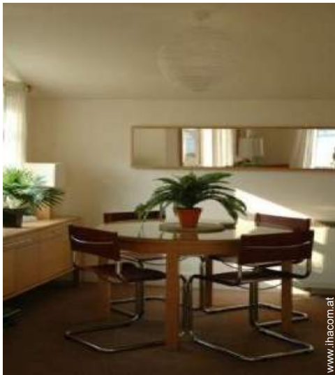
Cottage mit Charme