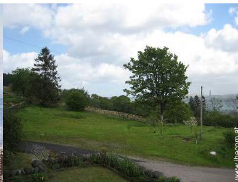
Blick auf Felder