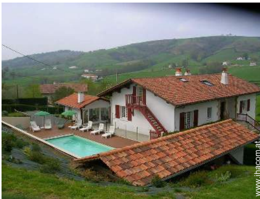
Blick auf Felder