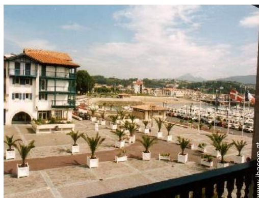
Blick auf Gebirge