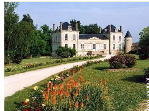
Schloss - Burg