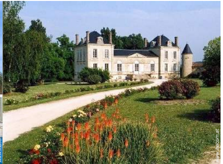
Schloss - Burg