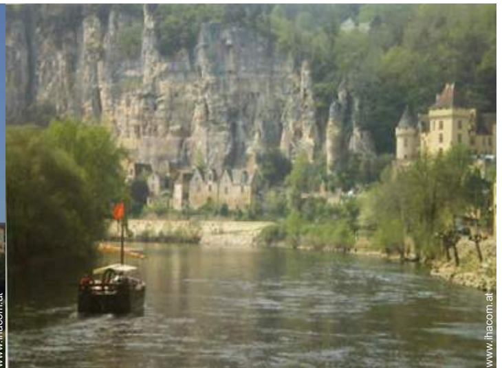
Blick auf Fluss