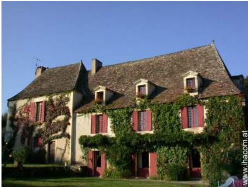
Bastide mit Charme