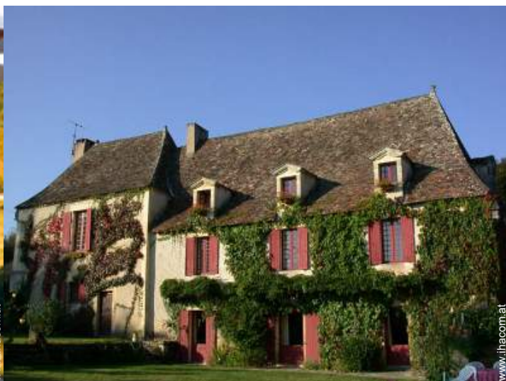
Bastide mit Charme