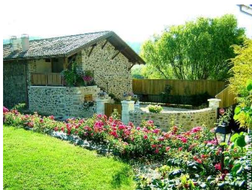
Haus mit Charme