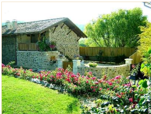
Haus mit Charme