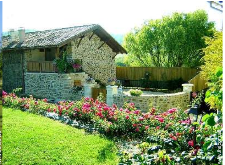
Haus mit Charme